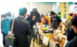
オリーブ牛試食会