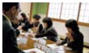
検査者選抜による食味試験

小豆島産オリーブの搾りカスに含まれるオレイン酸等の有効成分を活用した牛の機能性飼料を開発するとともに、その飼料を給与した牛の肉質検査、食味試験を実施し小豆島オリーブ牛のブランド確立を図る。