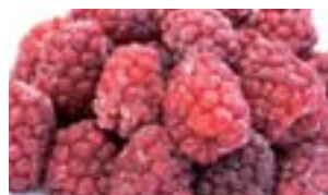
瞬間冷凍したポイセンベリー

三豊地域で減農薬・有機栽培されているポイセンベリー等のフルーツ類を使い、低脂肪・低コレステロールの香川県産フルーツベーグル等の新商品を開発し、さらに、新商品PRのため見本市への出展やHP作成により販路開拓を図る。