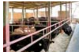
肉牛飼養管理技術