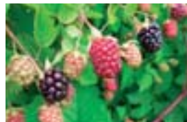
ポイセンベリー等の栽培技術