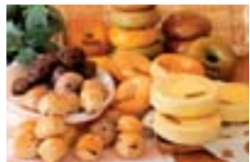
ベーグル等の製造技術