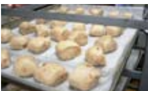
ポイセンベリー等を使った試作品