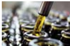
オリーブ加工技術