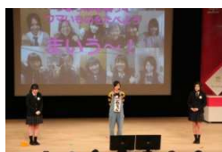
女性起業家大賞 (うまぐ)