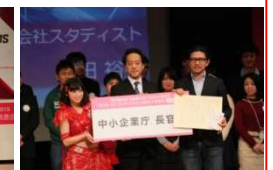
中小企業長官賞 (スタディスト)