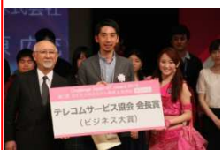
テレコムサービス協会会長賞 (ドレミングアジア)

自分の主張を的確に表現すること。インカムをつけ舞台を自由に動き、自分のプレゼンにあったスタイル&パフォーマンスを期待しています。