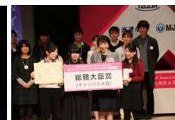
総務大臣賞 (ピアの極み乙女、)