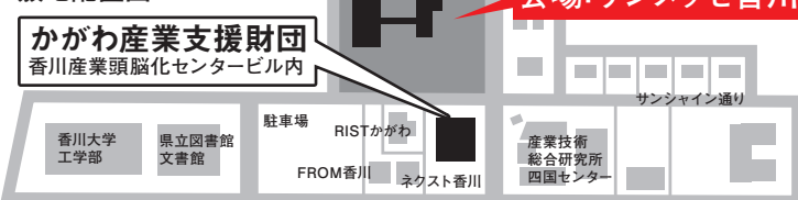
香川インテリジェントパーク 敷地配置図