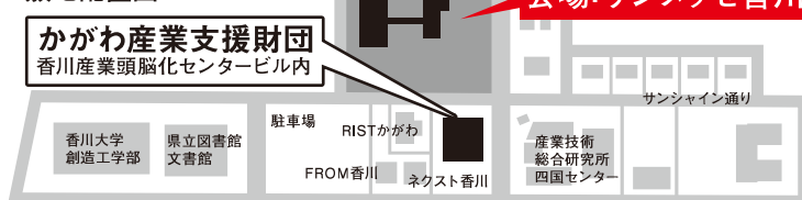
香川インテリジェントパーク 敷地配置図

流通経路短縮による利益率向上も見込める為、得られた利益を現場に還元し、人財確保につなげる。そうすることにより、産地の技術の継承と産業の発展を実現していく。