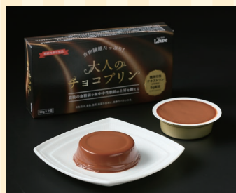
株式会社ルーヴ (高松市)