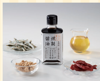
有限会社宮地醤油 醸造場(高松市)

うどん、骨付鳥に続く第3の香川名物。高松のB級グルメ。鶏肉をバター、塩胡椒、ガーリックパウダーで炒め醤油で風味付けした料理。