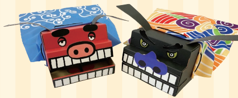
株式会社グッドワーク (三木町) ブースNo 3

どんな所でもどんな環境でも自立して立つ、ふしぎな棒。どのように使ってどう活かすかは、あなた次第です。