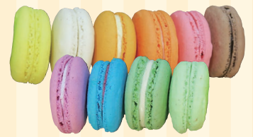
株式会社スミダ・リ・オリジン (高松市) ブースNo 7