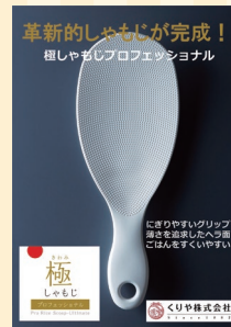
くりや株式会社 (さぬき市) ブースNo 13

ダンボール製の獅子の頭とゆたんを組み合わせるとオリジナルの獅子が作れます。他にも、ダンボール製グッズをご用意。