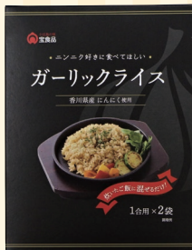
宝食品株式会社 (小豆島町) ブースNo 12

マカロンは6種類の味をご用意。好みのフレーバーをお楽しみいただけます。グルテンフリー専門店です。