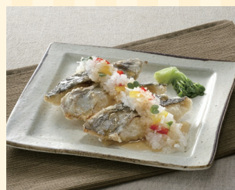
株式会社八栗 (高松市)