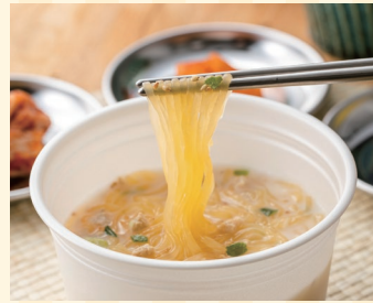
ハイスキー食品工業株式会社 (三木町) ブースNo 8

琴平町産にんにくを使用。1合用が2袋入。混ぜごはんでも、炒めごはんでも食べ方が選べます。