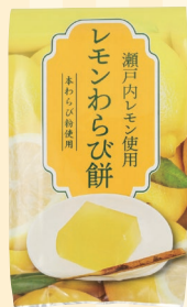
丸金食品株式会社 (小豆島町)