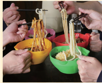
松浦産業株式会社 (善通寺市) ブースNo 10

独自製法で作ったカップこんにゃく麺。コクがあってまろやかな牛だしがやみつきになります。