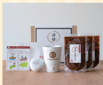
丸島醤油株式会社 (小豆島町)