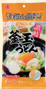
株式会社マルキン (観音寺市)