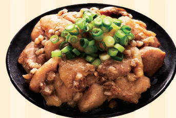
株式会社まんでがん (善通寺市)