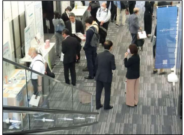
第 2 部 パネル等展示の観覧、交流の様子